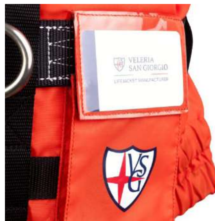
TASCA PORTA BADGE